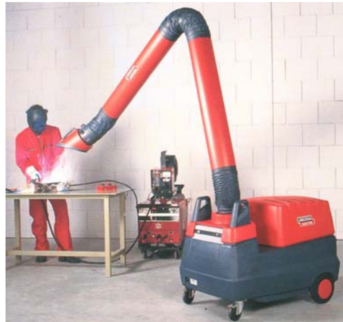
Mobiflex 200-M с 4 м рукавом