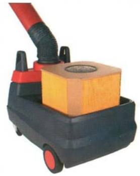
Фильтр и искрогаситель