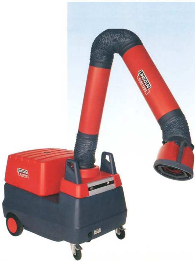
Mobiflex 200-M with 4 metre arm.

Мобильное низковакуумное вытяжное устройство Mobiflex 200-M предназначено для очистки окружающего воздуха и удаления сварочных газов и аэрозолей из рабочей зоны сварщика. Mobiflex 200-M используется при полуавтоматической сварке сплошной и порошковой проволокой в среде защитного газа, полуавтоматической сварке самозащитной порошковой проволокой, аргонодуговой и ручной дуговой сварке.